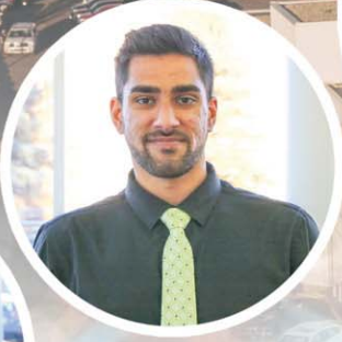
PREZ TIWANA NEW CAR PRODUCT ADVISOR