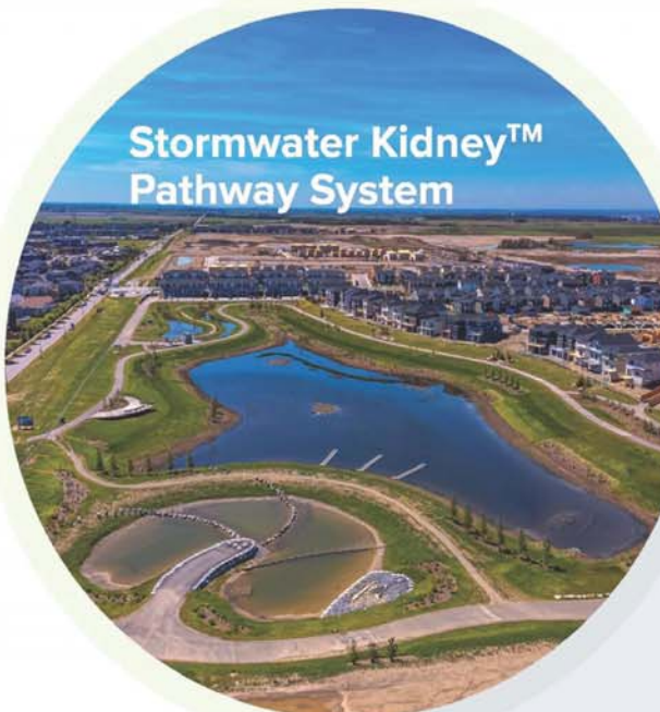
Stormwater Kidney™ Pathway System